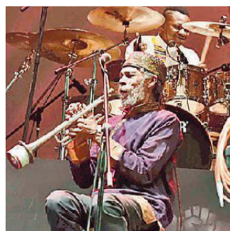
Liberation Project sarà a Ferrara

Si tratta di The Liberation Project, in concerto a Ferrara a Factory Grisù il 9 luglio, alle 21.30 al Consorzio Factory Grisù in via Poledrelli 21, per la Giornata Internazionale delle