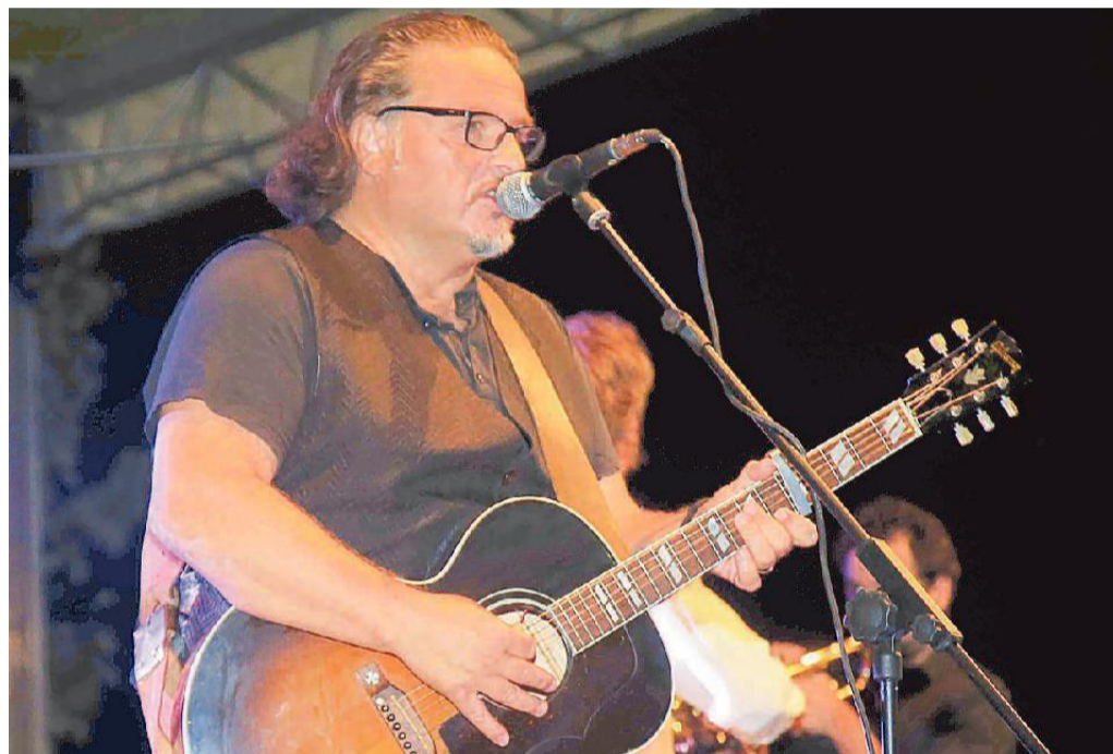
Cisco sarà in concerto nel giardino del Blackstar di Ferrara il 7 luglio con il suo "Indiani & cowboy"

La squadra che si sta occupando di tutto, oltre a Serra, è composta da altre realtà del settore come Roots, Massa-