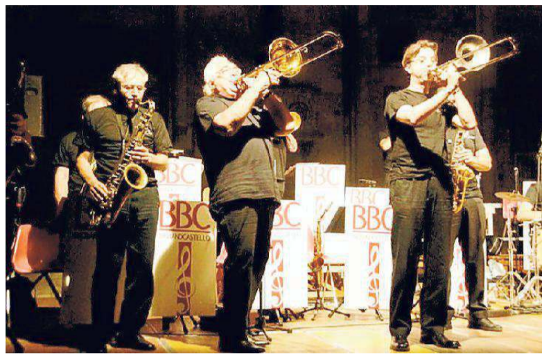
Alcuni musicisti della Big Band Castello

Claudio Rossato, artista veneto, espone alla tabaccheria Vento, di Manuel Frassinetti, in via del Perugino 2/4 a Modena, fino all'11 Ottobre. Orari: dal lunedì al sabato dalle 7.30 alle 13 e dalle 15.30 alle 19.30.