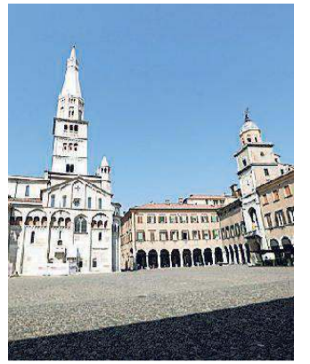
Piazza Grande, sito Unesco

tura, cibo e arte e lo si può fare anche attraverso i social e il digitale». Un connubio importante quello tra cibo e arte, in occasione anche del 20° anniversario dall'inserimento tra i siti Unesco del Complesso Monumentale di Piazza Grande. Tra gli ospiti anche critici d'arte, giornalisti del settore artistico e culinario e l'assessore regionale all'agricoltura Simona Caselli, che ha parlato di sviluppo in crescita: «Dobbiamo avere uno sviluppo che trasmetta il senso di ciò che siamo, puntare all'agroalimentare e al digitale».