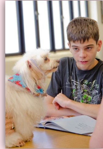
Persone affette da malattie o disabilità